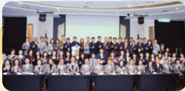
第七、八、九專分區分會-會務分享會