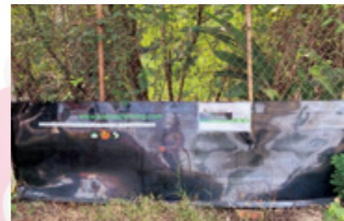
水雉園區社服秋季郊遊