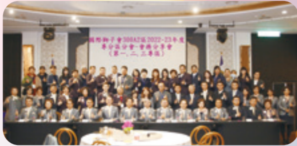
第一、二、三專分區分會-會務分享會