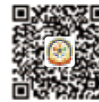
獅誼月刊臉書粉絲頁