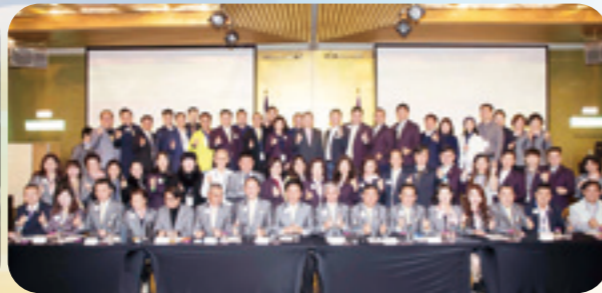
第十、十一、十二、十三專分區分會-會務分享會