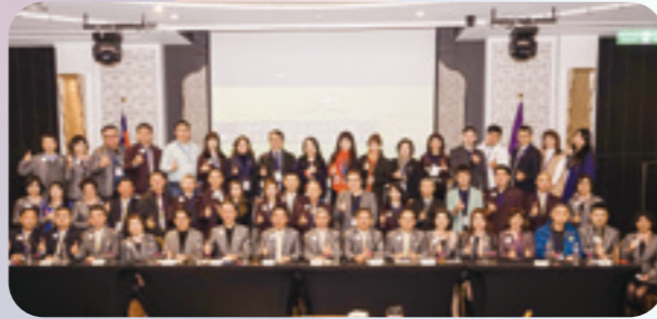
第四、五、六專分區分會-會務分享會