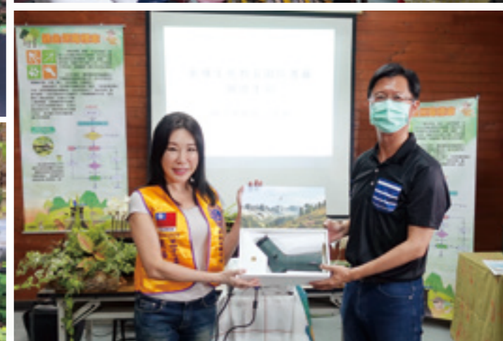
台南社服秋季郊遊