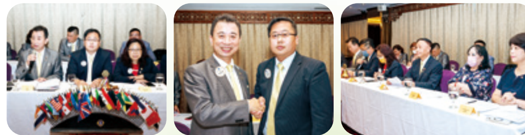
撰文 / 第五專區採訪委員 林黎明