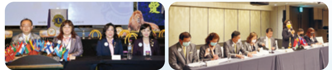
撰文 / 第七專區採訪委員 謝耀德