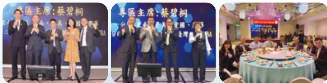
撰文 / 採訪組長 曾文星