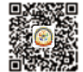
獅誼月刊臉書粉絲頁