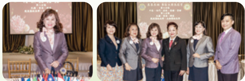
撰文 / 第四專區採訪委員 黃佩鈺